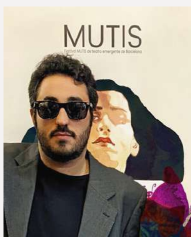
Misael Sanroque AUTOR