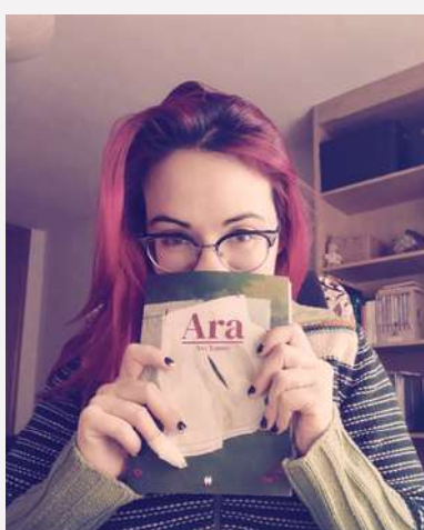
Ana Torres AUTORA